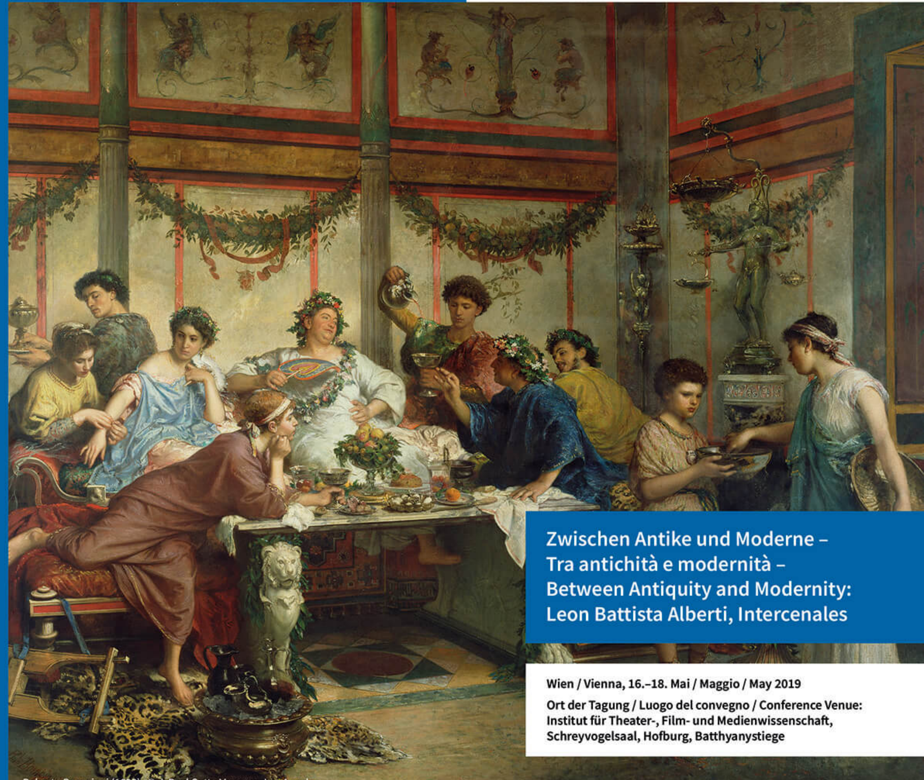
Roberto Bompiani (1892)