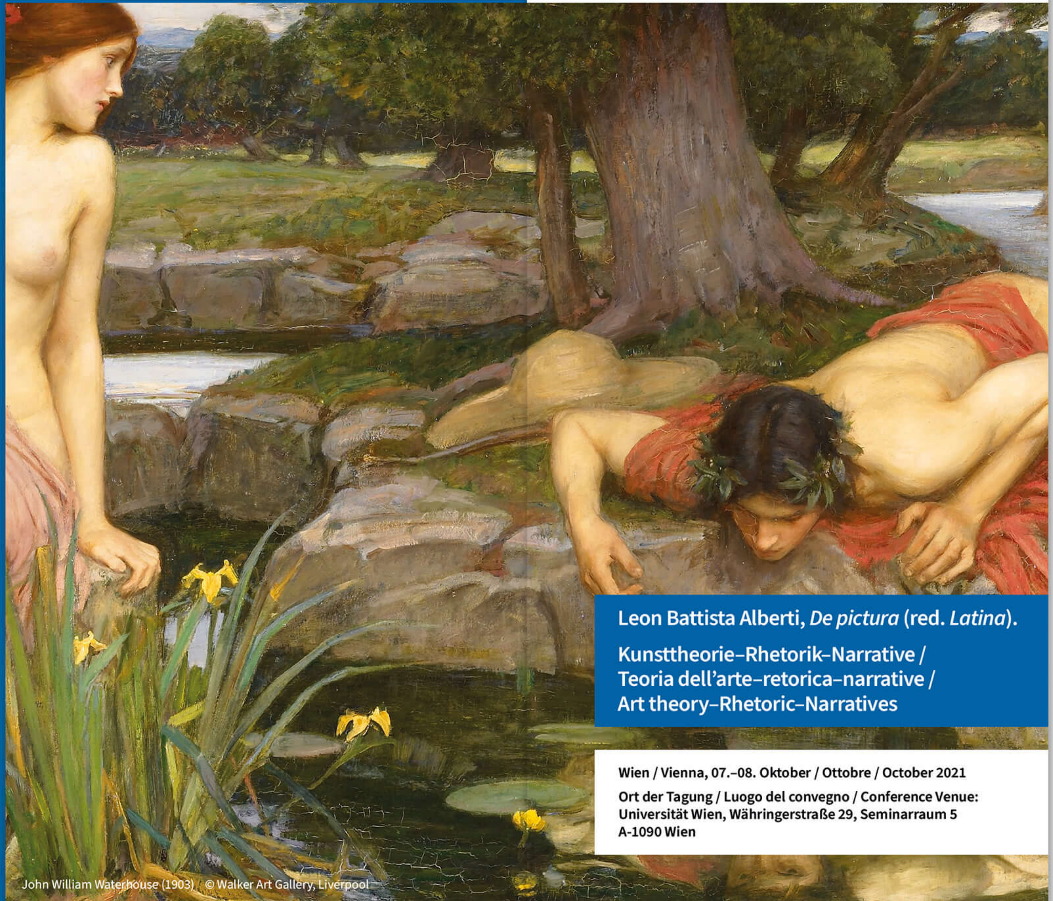
Leon Battista Alberti, De pictura (red. Latina). Kunsttheorie-Rhetorik-Narrative / Teoria dell'arte-retorica-narrative / Art theory-Rhetoric-Narratives

Wien / Vienna, 07.-08. Oktober / Ottobre / October 2021 Ort der Tagung / Luogo del convegno / Conference Venue: Universität Wien, Währingerstraße 29, Seminarraum 5 A-1090 Wien